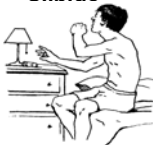
Despertar en la Noche